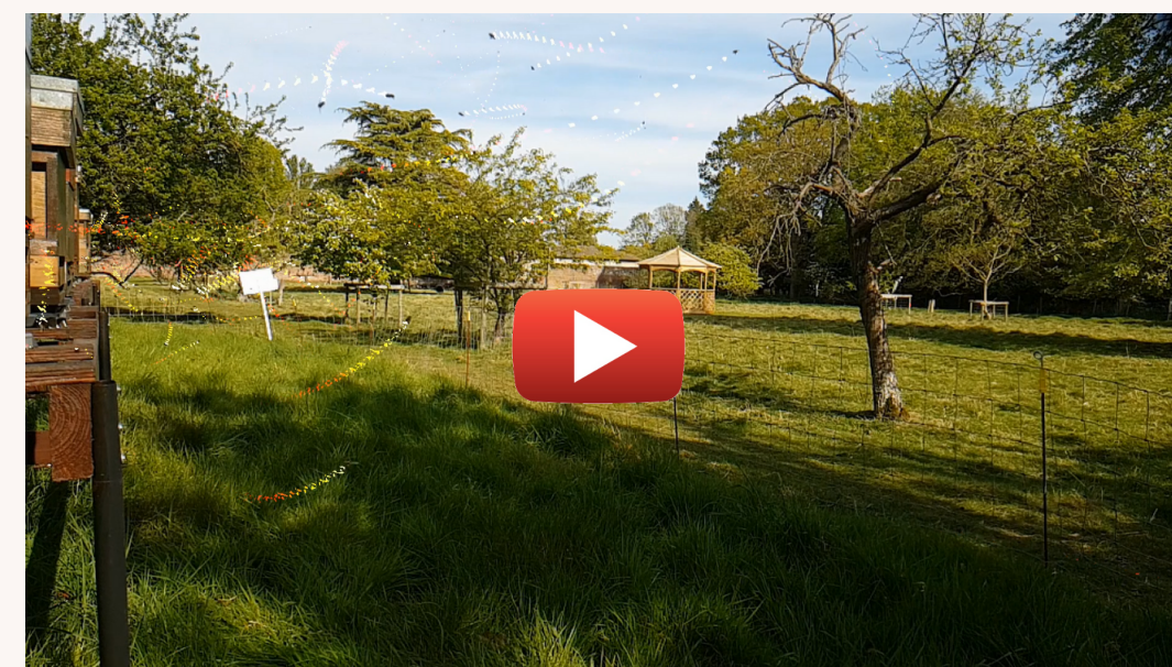
Bee trafficking at the B-GOOD UK mini-apiary

Initialement filmé en 240 FPS, puis ralenti en 30 FPS, ce surprenant petit montage capture le trafic intense devant les ruches du rucher anglais de B-GOOD.