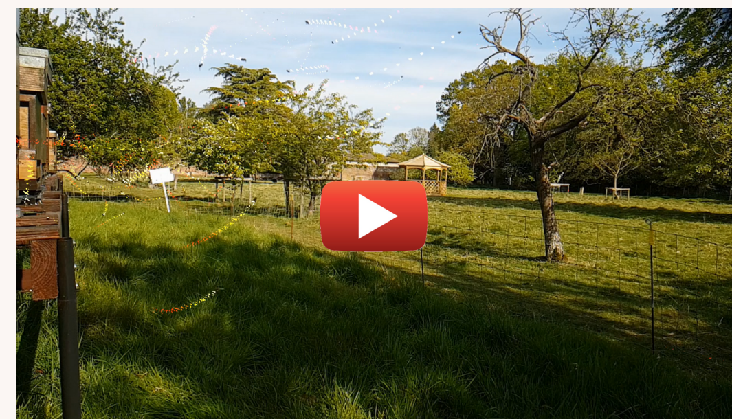
Bee trafficking at the B-GOOD UK mini-apiry

Оригинално заснет в 240 кадъра в секунда и забавен до 30 кадъра в секунда, този кратък монтаж заснема интензивния трафик на пчелите в мини-пчелина на B-GOOD в Обединеното Кралство.